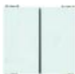
Ref.: M4353 Variador de Luminosidade "Dimmer" digital (bivolt)