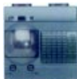
Sensor de Presença