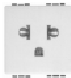
N4126/45 Tomada 2P+T e universal