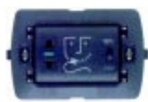
Tomada para Barbeador com Transformador