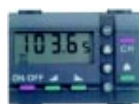
Sintonizador de Rádio