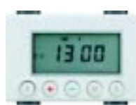
Programador diário e semanal