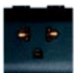
Tomada 2P+T e universal