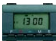
Programador Diário / Semanal