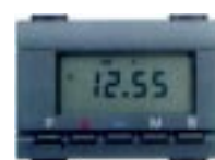
Relógio / Despertador