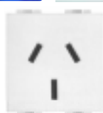
N4194 Tomada 3P