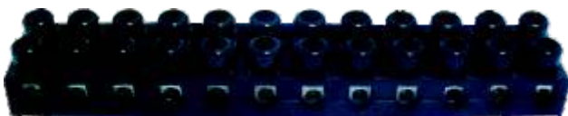
Ref. 412 - 600V / 25A até 6mm 2